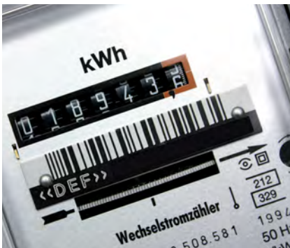
Strom: mindestens 2 x pro Jahr kontrollieren, ggf. Unterzähler einbauen.

Auf den folgenden Seiten erfahren Sie alles Wissenswerte über richtiges Heizen und Lüften sowie praktische Beispiele, was Sie zu Hause tun können. Dazu gehört auch, wie Sie Schimmel in den eigenen vier Wänden vermeiden können.