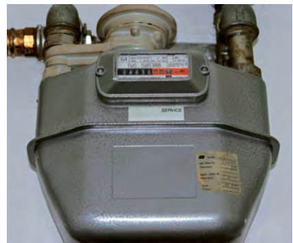
Erdgas: mindestens 2 x pro Jahr kontrollieren.